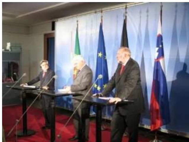
Predstavitve 18-mesečnega programa predsedovanja EU v Berlinu 5. decembra 2006

Prednostne naloge slovenskega predsedovanja bodo predvidoma prihodnost Evrope in institucionalni razvoj, širitev in sosedska politika, energetika, medkulturni dialog ter teme, ki izhajajo iz Lizbonske strategije. Slovenija bo v času predsedovanja EU poleg formalnih sestankov v Bruslju, ki jih bo okoli 2000, organizirala še osem neformalnih ministrskih srečanj, približno 130 dogodkov pod ministrsko ravno v Sloveniji ter približno 220 dogodkov v okviru sodelovanja EU s tretjimi državami v Sloveniji in v tujini. Velik, predvsem logistični zalogaj v okviru priprav je bila selitev stalnega predstavništva pri EU v Bruslju v nove prostore, ki so jih odprli decembra 2006.