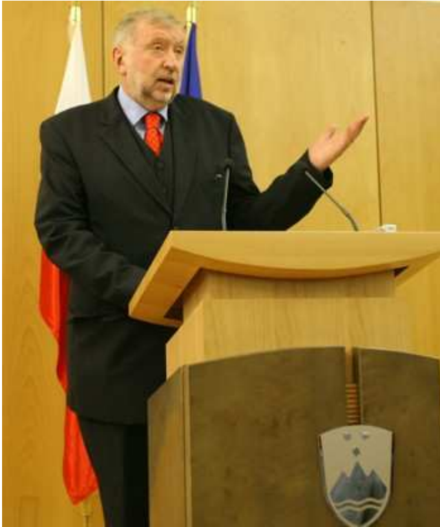
Zunanji minister dr. Dimitrij Rupel na predstavitvi dela ministrstva v letu 2006 20. novembra 2006