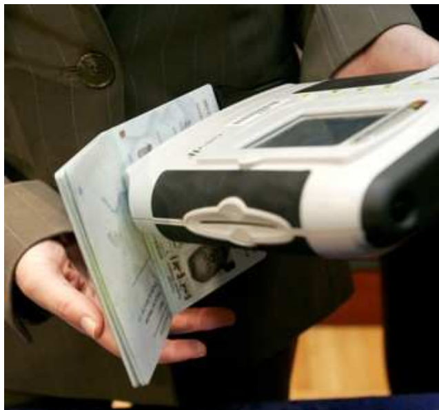
Odčitavanje podatkov iz biometričnega potnega lista

Kot nosilec podskupine za program je MZZ skupaj s Službo vlade za evropske zadeve (SVEZ) uskladil 18-mesečni program predsedovanja skupaj s predhodno predsedujočima Nemčijo in Portugalsko, sodeluje pa tudi z naslednjimi tremi predsedujočimi, Francijo, Švedsko in Češko. 18-mesečni program je po prednostnih nalogah razdeljen na več področij. Med njimi so prihodnost Evrope, uresničevanje Lizbonske strategije, krepitev svobode, notranje varnosti in razvoja evropskega pravnega reda, krepitev zunanje varnosti in zunanjih ekonomskih odnosov ter krepitev vloge EU kot globalnega akterja.