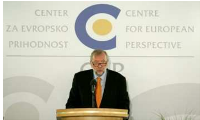
Zunanji minister Dimitrij Rupel na odprtju Centra za evropsko prihodnost 23. maja 2006

Strateški forum Bled, ki ga je ministrstvo ustanovilo v sodelovanju z Inštitutom za strateške študije v Ljubljani, pa naj bi dal politični zagon uresničevanju novih strategij, ki bi Evropi omogočile boljše izrabo njene strateške teže, ter hkrati spodbujal politično zavezanost tem strategijam. Kot prvo v sklopu mednarodnih dogodkov so avgusta 2006 organizirali mednarodno konferenco z naslovom Kaspjski obeti 2008, na katero so bili povabljeni najvidnejši mednarodni strokovnjaki, politični voditelji, predstavniki mednarodnih organizacij s tega področja in iz zasebnega sektorja iz kaspijske regije, Evrope, ZDA, Rusije in od drugod.